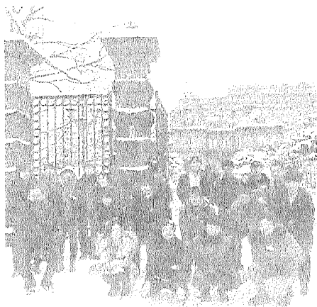
【SAPPORO QUEST 集合写真】

内容は、雪の舞う札幌市内の町並みを散策し、各目的地で交流集会スタッフから出題される問題を解きながらゴールを目指すというものでした。雪も降り注ぐ極寒の札幌市内を長時間に掛けて散策するのは大変過酷でしたが、同じグループになった他支部(各地域の運輸、航空、気象、港湾、建設等)の青年層と交流を深める良い機会にもなりました。