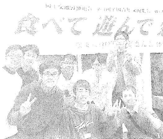
【東海建設支部メンバー 集合写真】

また、『SAPPOROのQUEST』で出題された複数の問題に正解し、優秀だったグループには豪華賞品(立派な毛蟹を一人一杯)が贈呈される等、懇親会は終始盛り上がりを見せ思い出となりました。